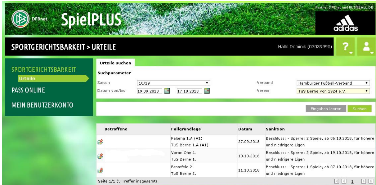
Abbildung 2: Einsicht der Entscheidungen (Daten der Betroffenen aus Datenschutz-Gründen entfernt)