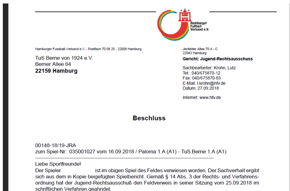
Abbildung 3: Geöffnete PDF mit dem detaillierten Urteil